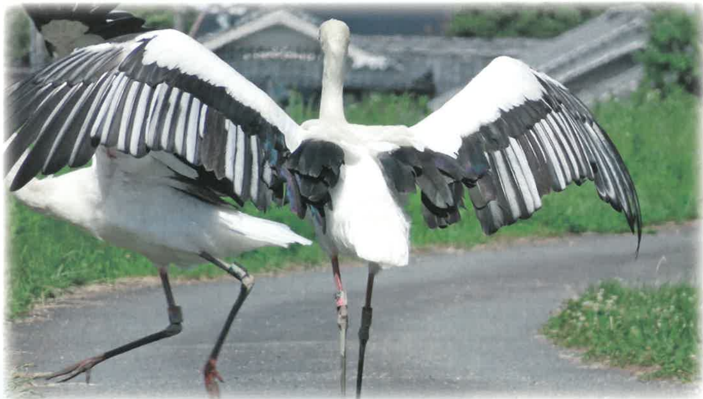
北油良の田んぼ道を歩くコウノトリ

= 編集 = 幸世地域づくり運営委員会 TEL/FAX (0795) 82-5038 【発行日：令和5年7月】