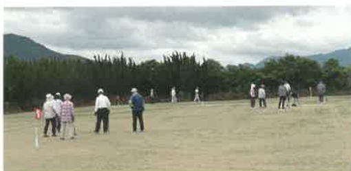
グラウンドゴルフ同好会

グラウンドゴルフや運動会等の地域のスポーツ大会をはじめ様々なスポーツを楽しめます。