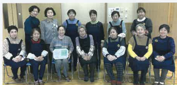
ふれあいサロンを運営する幸世ボランティアグループのみなさん