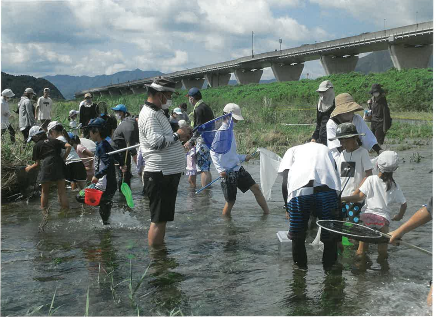
「水ノ川探索 川で遊ぼう」(令和5年7月16日)

=編集= 幸世地域づくり運営委員会 TEL/FAX(0795)82-5038 【発行日】：令和6年7月